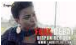
Faux débat réalisé par Bobo Herico, le 20 mai à 16h