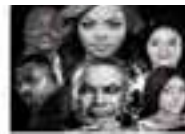
Légitime défense réalisé par Fatoumata Kandé, le 21 mai à 16h