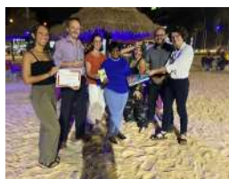
Cours de Soso

Cours de langue soso : 800.000 GNF le module de 20h.